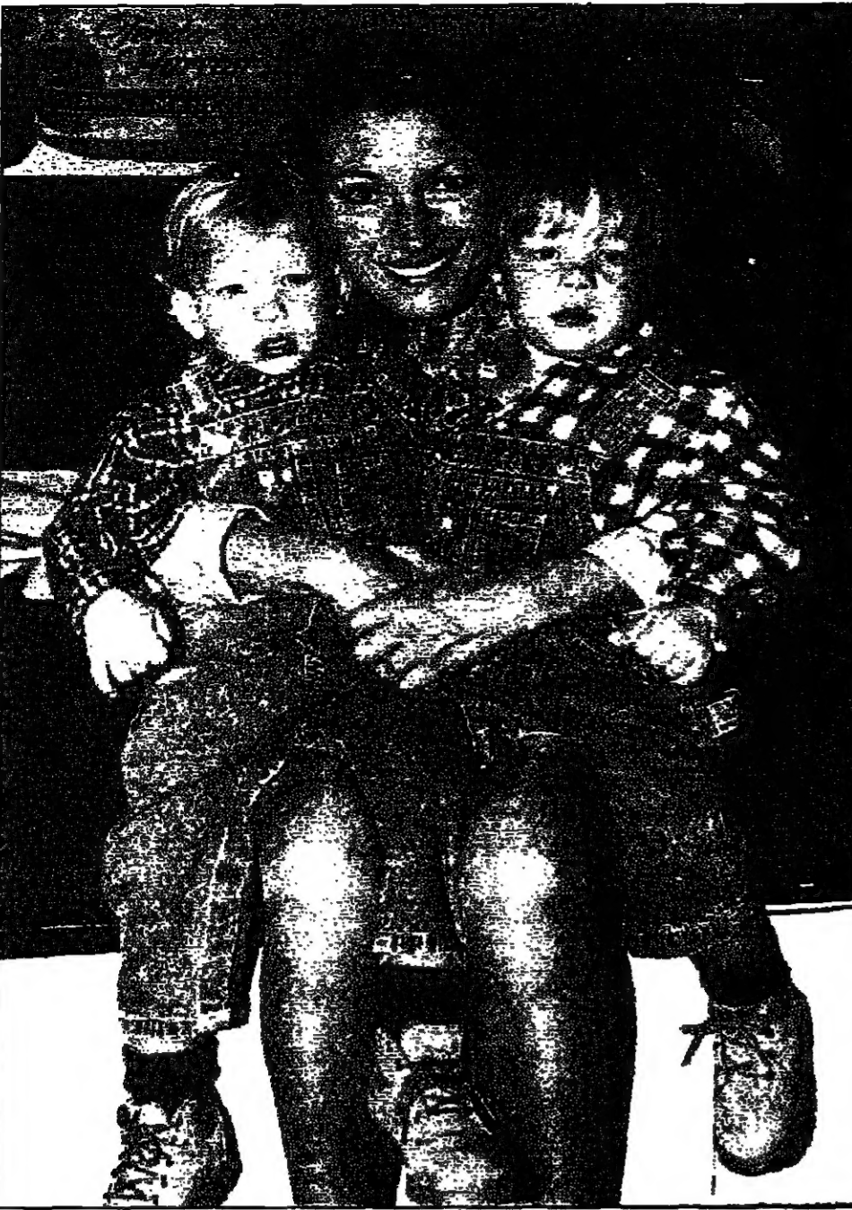
النجمة جين سيمور تحضن طفليها التوام - ومرهما عامان - كريستوفر (الى اليسار) وجون ضمن اعلان عن فداء للاطفال.